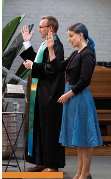
COLLECTE PROTESTANTSE KERK PASTORAAT