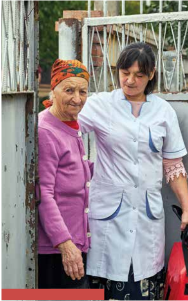
COLLECTE KERK IN ACTIE WERELDDIACONAAT