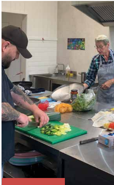
COLLECTE KERK IN ACTIE BINNENLANDS DIACONAAT