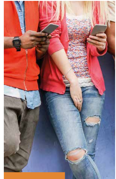
COLLECTE PROTESTANTSE KERK MISSIONAIR WERK